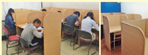
高志塾自習ブース 左/本校 右/下鴨校

高志塾の各教室には、 通塾していれば誰でも 利用できる自習スペ ースを用意してあり ます。受験生はもちろ ん、テスト前の生徒 やほまた、先生に呼 び出され特訓させら れている生徒まで、 ぜひとも自習スペ ースをご活用くださ い!!